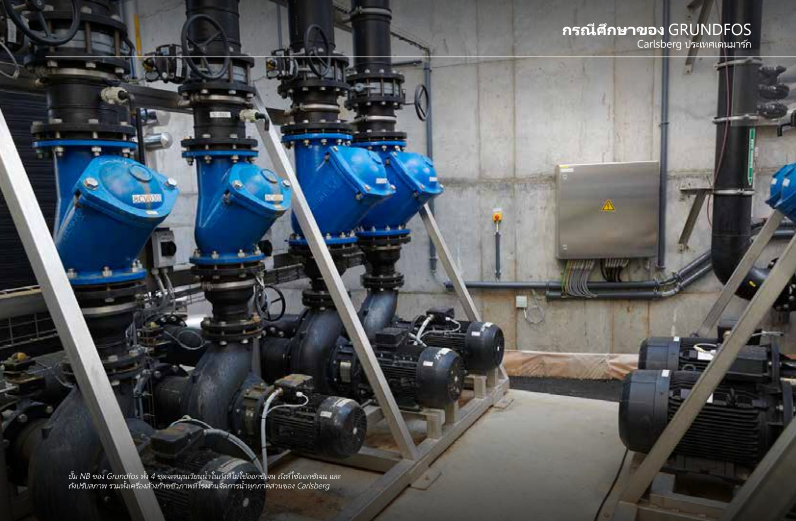
ปั๊ม NB ของ Grundfos ทั้ง 4 ชุดจะหมุนเวียนน้ำในถังที่ไม่ใช้ออกซิเจน ถังที่ใช้ออกซิเจน และถังปรับสภาพ รวมทั้งเครื่องล้างก๊าซชีวภาพที่โรงงานจัดการน้ำทุกภาคส่วนของ Carlsberg