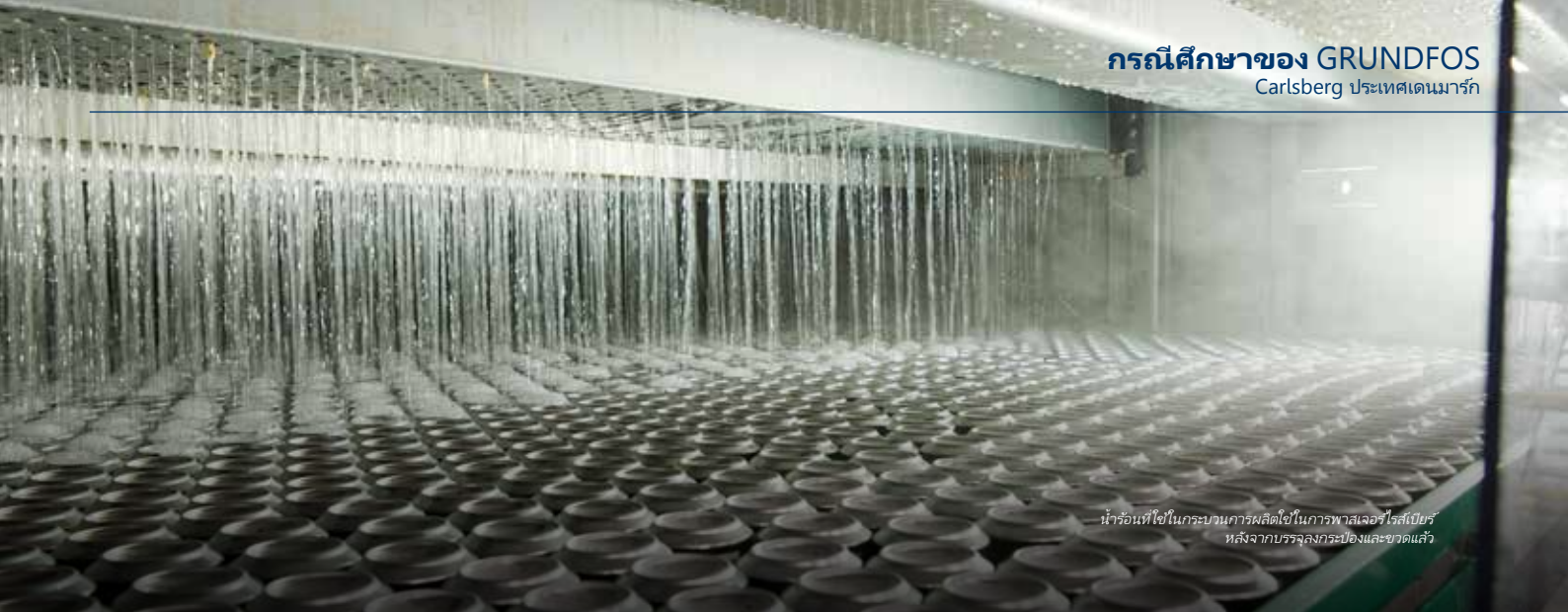
น้ำร้อนที่ใช้ในกระบวนการผลิตไซในการพาสเจอร์ไรส์เบียร์ หลังจากบรรจุลงกระป๋องและขวดแล้ว