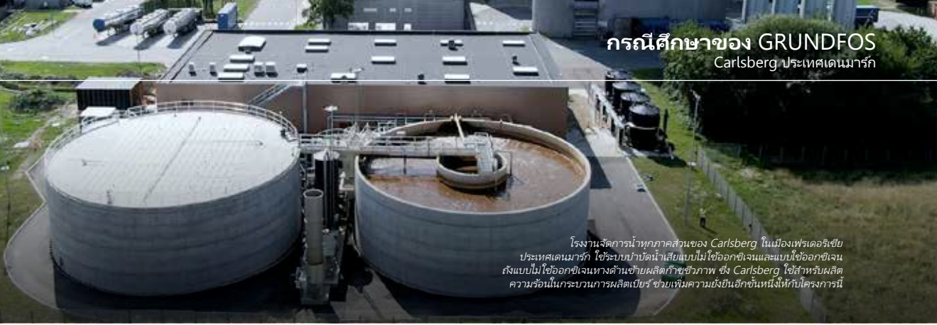
โรงงานจัดการน้ำทุกภาคส่วนของ Carlsberg ในเมืองเฟรเดอริชเบิร์ก ประเทศเดนมาร์ก ใช้ระบบบำบัดน้ำเสียแบบไม่ใช้ออกซิเจนและแบบใช้ออกซิเจน รวมถึงแบบไม่ใช้ออกซิเจนทางด้านซ้ายผลิตก๊าซชีวภาพ ซึ่ง Carlsberg ใช้สำหรับผลิตความร้อนในกระบวนการผลิตเบียร์ ช่วยเพิ่มความยั่งยืนอีกขั้นหนึ่งให้กับโครงการนี้