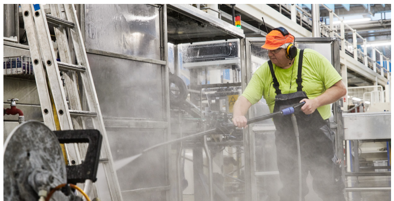
In de fabriek wordt proceswater gebruikt voor het reinigen van apparatuur, vloeren en oppervlakken, leidingen en tanks, fles- en blikwasmachines, en meer.