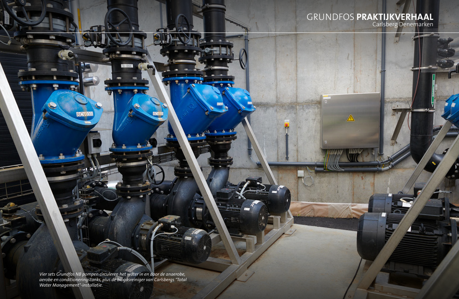
Vier sets Grundfos NB pompen circuleren het water in en door de anaerobe, aerobe en conditioneringstanks, plus de biogasreiniger van Carlsbergs "Total Water Management"-installatie.